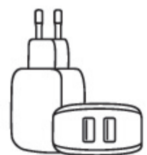
Сетевое зарядное устройство USB